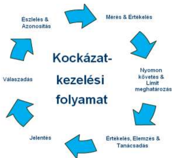
Ábra 4: Kockázatkezelés körfolyamata

A kockázatkezelési folyamatot az alábbi ábra illusztrálja: