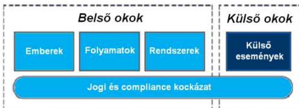
Ábra 5: Működési kockázat definíciójának sematikus ábrája

„A működési kockázat annak a kockázata, hogy az elégtelen belső eljárásokból, emberi hibából vagy rendszerekből és külső eseményekből eredően veszteség keletkezik”.