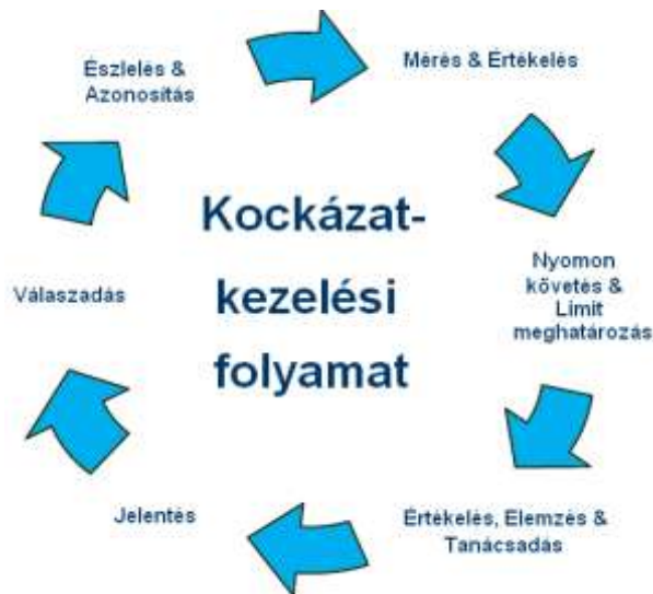
Ábra 4: Kockázatkezelés körfolyamata

A kockázatkezelési folyamatot az alábbi ábra illusztrálja: