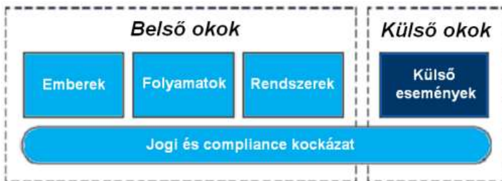
Ábra 5: Működési kockázat definíciójának sematikus ábrája

„A működési kockázat annak a kockázata, hogy az elégtelen belső eljárásokból, emberi hibából vagy rendszerekből és külső eseményekből eredően veszteség keletkezik”.