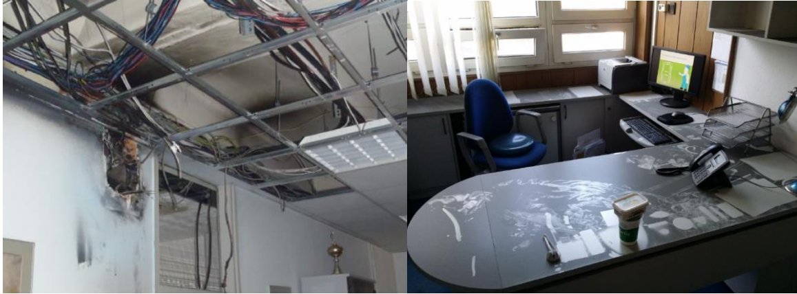
A kigyulladt elosztó környezetének koromszennyeződése

kis részre terjedt ki. A villamos berendezés rendszeres és alapos felülvizsgálatával csökkenthető az ilyen jellegű balesetek bekövetkezésének valószínűsége is.